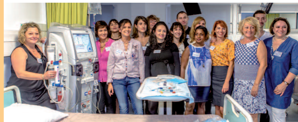
L'équipe au complet du nouveau centre de dialyse

À sa création, en 1989, les diabétiques insuffisants rénaux du territoire de santé de Narbonne devaient se rendre à Perpignan, Carcassonne ou même Montpellier pour se faire soigner. 25 ans après, le nouveau centre, qui couvre tous les niveaux de la prise en charge de l'insuffisance rénale, a été inauguré.